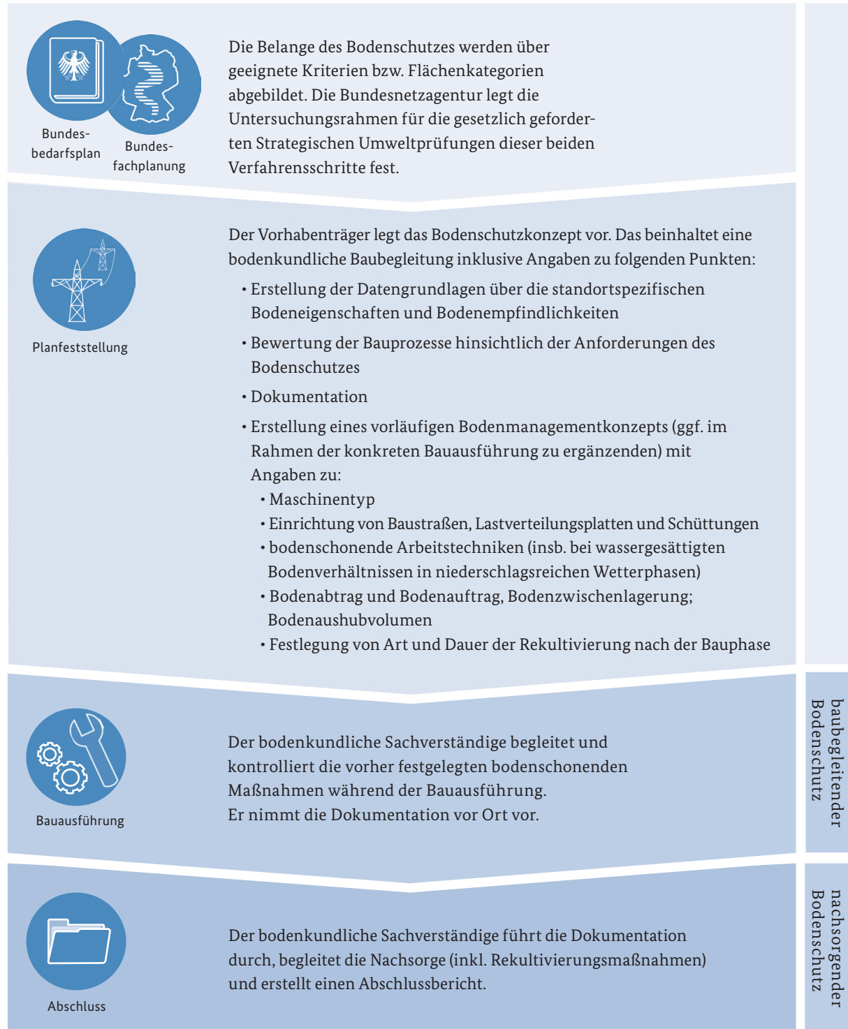
Abbildung 2: Bodenschutz in den Verfahrensschritten der Erdkabelvorhaben des Stromnetzausbaus 31

Des Weiteren werden im Planfeststellungsbeschluss Regelungen zur Einbindung der zuständigen Bodenschutzbehörde durch die Bundesnetzagentur festzulegen sein: So sind der zuständigen Bodenschutzbehörde